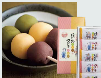
【一六本舗】 坊ちゃんだんご・マドンナだんご(5本入).....648円