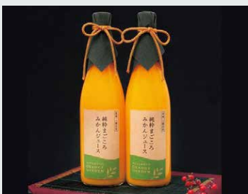
【ミヤモトオレンジガーデン】 純粋まごころみかんジュース (1本/780ml).....2,160円