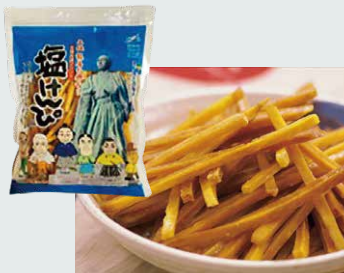
【南国製菓】 龍馬塩けんぴ(200g).....486円