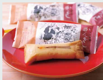
【菓舗 浜幸】 かんざし(7個入).....864円