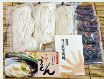
【日の出製麺所】 ぶっかけうどん(箱/8人前).....1,188円