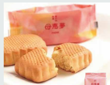
【母恵夢本舗】 ベビー母恵夢 (6個入).....540円