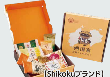
【Shikokuブランド】 四国4県銘菓セット...1,296円