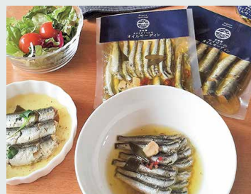
【共栄冷凍水産】 伊吹島カタクチワシのオイル サーディン(固形量45g).....756円