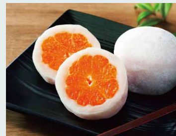
【一福百果・清光堂】 まるごとみかん大福(1個).....540円