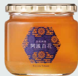
【梶浦養蜂園】 阿波百花 (国産はちみつ/400g).....1,927円